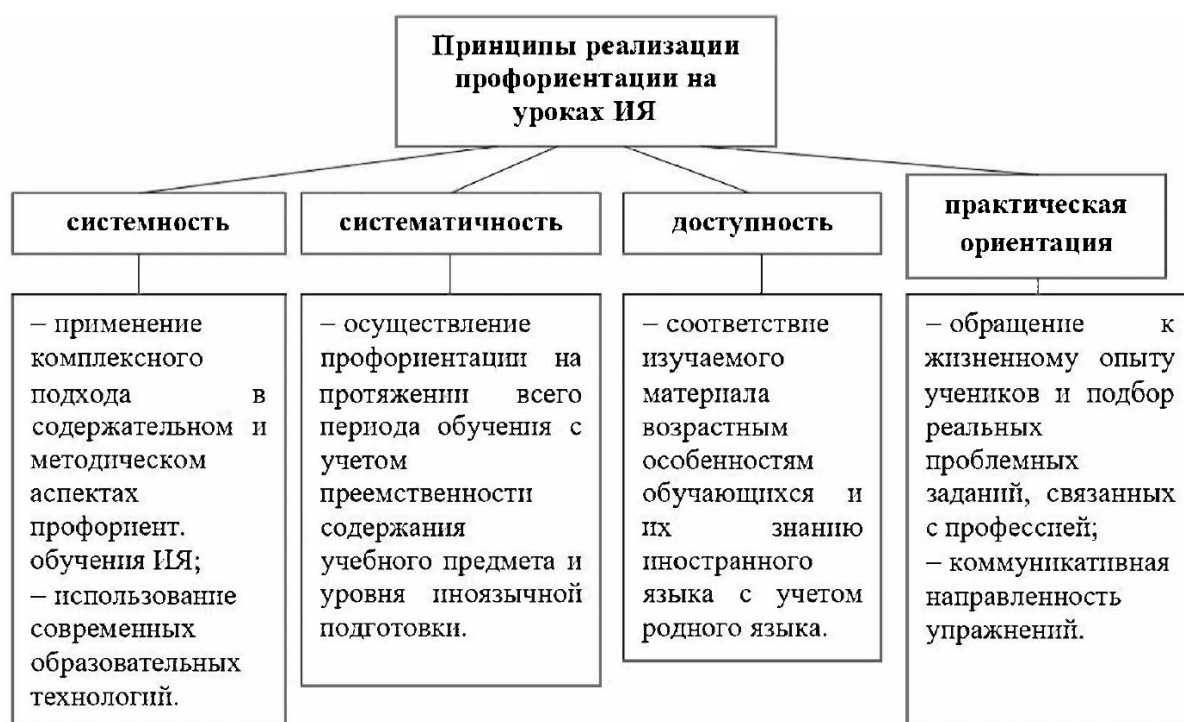
Рис. 1. Принципы реализации профориентации на уроках ИЯ

Профориентация на учебных занятиях по иностранному языку (ИЯ) должна опираться на следующие принципы (рис. 1):